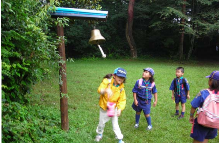
↑ 「鐘をならせ！」 明日(あした)の鐘といいます。 ちなみにこの鐘は日本ギルウェルコースで使用された 配給の鐘です。