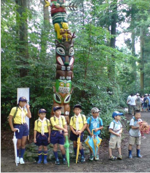
↑ 壬生第1団CS&BVS隊 発団の思いが伝わります