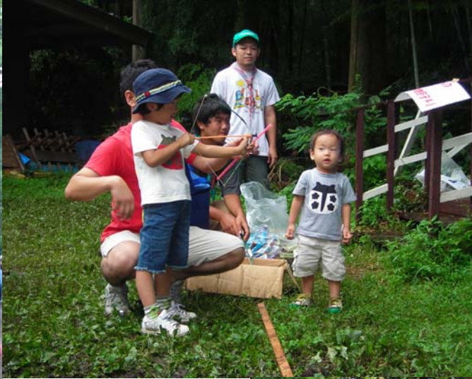
↑ 「良く狙って・・・」 「お姉ちゃん頑張っ！」 森の獲物狩り？