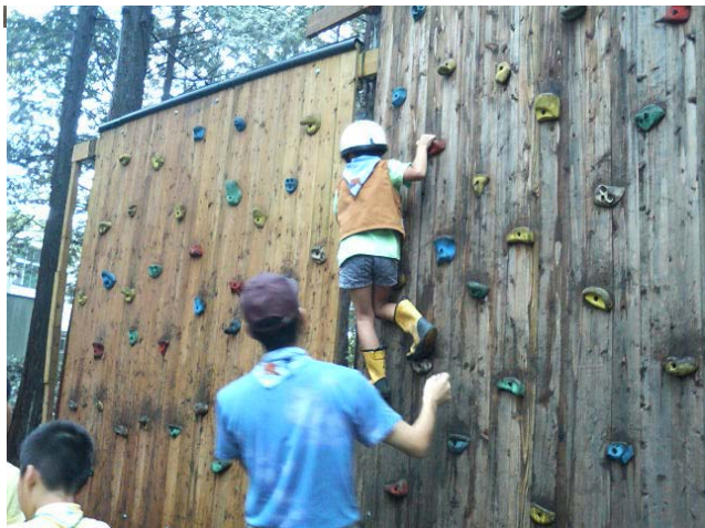
← え？ ビーバーだよね・・・ 2ブロックを終えて・・・ 3ブロックに・・・ でも、 その手つきは・・・ 経験者？