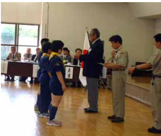
優良スカウト章(カブスカウト)の3名

※ 他にも特別年功賞・県連有功章・隊褒章綬・おおり章などの表彰が行われましたが、紙面の都合により割愛させていただきました。