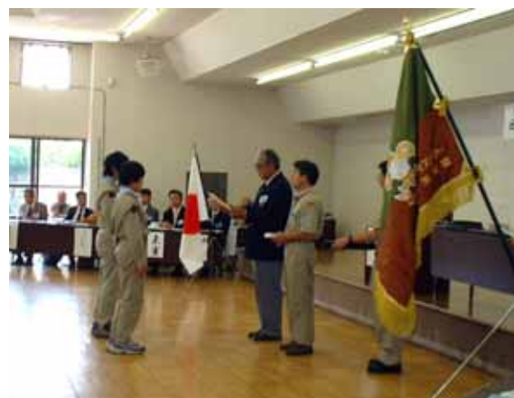
理事長から善行章を受ける2名のスカウト