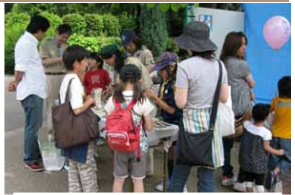
指導者と一緒にカブスカウトが鉄砲作りを説明