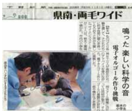
電子オルゴールをつくる小学生