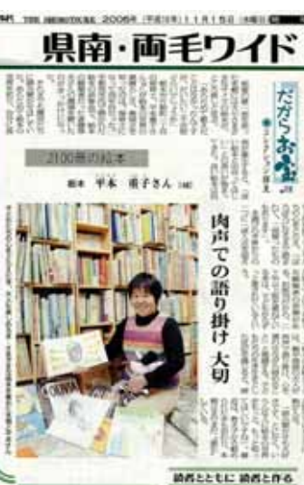
2100冊の絵本を持っているそうです。