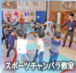
スポーツチャンバラ教室